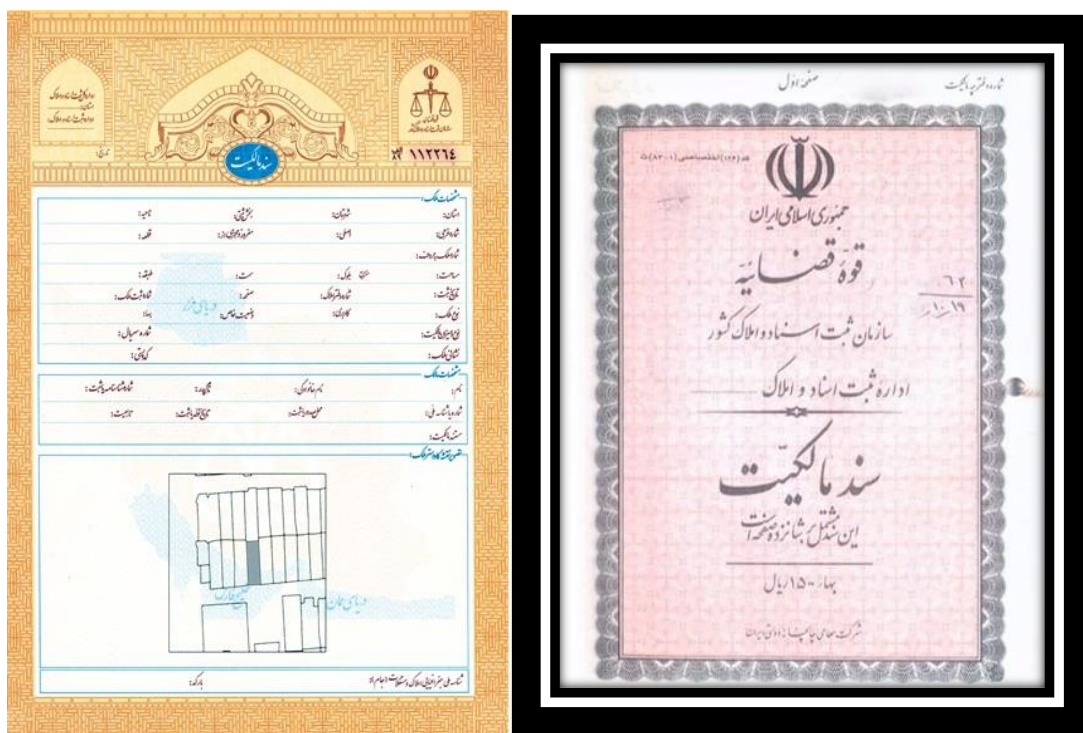
سه: روش سخت دریافت سند تک برگی و تغییر سند قدیمی ملک

اما به طور کلی هزینه صدور سند تک برگی چیزی حدود ۵۰۰ هزار تا ۲ میلیون تومان خواهد بود که با توجه به عوامل مختلف معین می شود. یکی از عوامل تعیین کننده هزینه صدور سند تک برگی مشخصات ملک می باشد. به عنوان مثال اگر ملک بزرگتر باشد و دارای متراژ بیشتری باشد هزینه صدور سند تک برگی آن نیز بیشتر خواهد بود و مواردی مثل نوساز بودن ملک، امکانات ملک و ... نیز در تعیین هزینه صدور سند تک برگی آن موثر خواهند بود. ۶۴